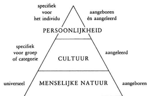
Figuur 1.1 Drie niveaus van mentale programmering

Persoonlijkheid van een individu is zijn of haar eigen stuk mentale programmering. Deze wordt gedeeltelijk aangeboren binnen de unieke reeks genen van het individu en is gedeeltelijk aangeleerd. 'Aangeleerd' betekent: gevormd door zowel de invloed van collectieve programmering (cultuur) als door unieke persoonlijke ervaringen.